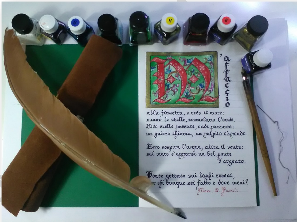
Esempio di quaternio eseguito con cartoncino e fogli di carta cotone rilegati. Semplice miniatura e testo in scrittura gotica.