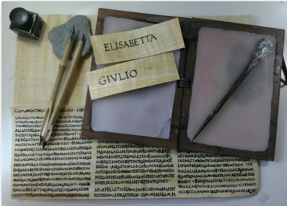
Tavoletta cerata e stilo. Commentarii de bello gallico in capitale romana eseguito su papiro con calamo di bambù.