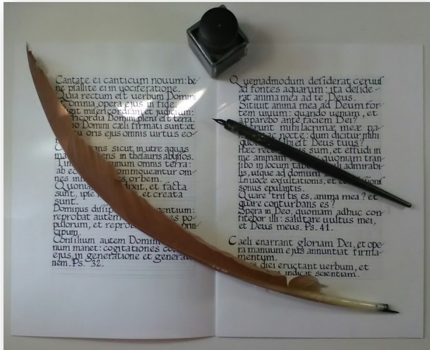
Liber psalmodum. Testo in minuscola carolina su fogli di carta cotone eseguito con inchiostro e penna d'oca.